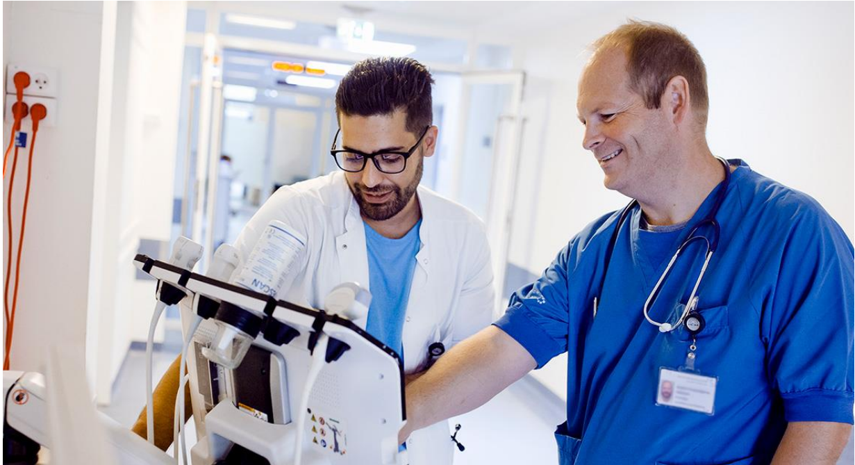
Speciallæger bevarer som udgangspunkt deres lokale løntillæg efter 1. april 2027.

Hvad sker der med lokalaftaler, hvis den nye fælles overenskomst for speciallæger og overlæger bliver vedtaget?